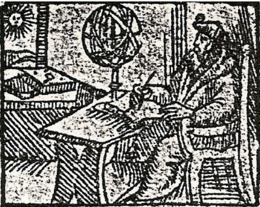
【図】1555A/V・1557Uの版画(上)と1557B(下)の版画[10]

まず、ジェラルド・モリスは、1557Bが1557年1月の大市に向けて前年の11月3日に刊行されたものであって、1557年9月6日に先行する版であったと推測した(Morisse 2004)。これは標題紙に「1557」とある一方、末尾には「11月3日刷了」とだけあって年が書かれていないことに注目した説である。これに対して、当時まだ通用していた旧方式の暦法(復活祭の頃を年始とする)では、1557年1月の大市の時期は「1556年1月」となるため、ギナールは標題紙に1557年と明記されていることとは整合しないとして、モリスの説を疑問視した(Guinard 2008: 29)。