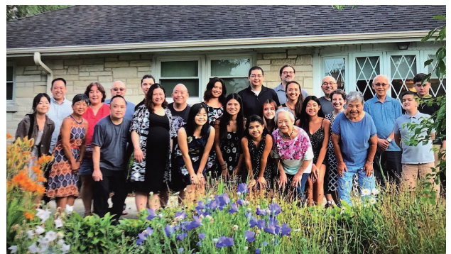
日系人強制収容所を体験した二世、三世と四世達の笑顔 2021年春 シカゴにて